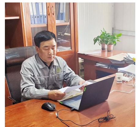
尊敬的各位领导、各位同仁：今天，我作为公司优秀党务工作者代表在这里发言，感到十分荣幸。借此机会，请允许我代表山西分公司党支部向一直关心、支持我的工作，并给予我们厚爱的公司的各位领导表示衷心的感谢。

山西分公司党支部成立于2019年8月，目前共有党员141名，其中，科级以上管理人员15名，党员25名，其中正式党员21名，预备党员4名，是一个充满活力的年轻党支部。一直以来，山西分公司党支部紧紧围绕公司党委发展战略，在凝聚人心、服务员工、促进生产等方面，充分发挥党组织的战斗堡垒作用和党员的先锋模范作用，为分公司快速健康发展提供了坚强的组织保障。2021年，分公司新发展党员6名，完成营业收入6亿元，利润2430.45万元，超额完成了公司下达的经济指标，实现了快速、健康发展。