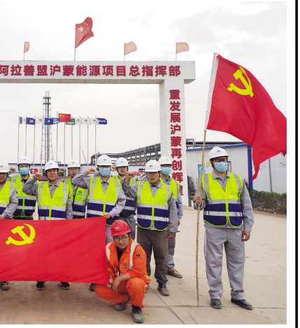
阿拉善盟沪蒙煤化工项目总指挥部

分公司成立以来，我们的党建工作与生产经营呈现出良好的发展态势，也取得了集团公司“先进基层党组织”、“四好领导班子”等荣誉称号，但面对新形势、新任务，尤其是实现公司“创一流企业、筑百年品牌”目标的攻坚时期，我将以此次表彰大会为新的起点，更加忠诚党的事业，更加努力地工作，进一步提升党支部的凝聚力和号召力，争取为公司高质量发展做出新的更大的贡献。